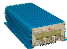
Orion IP67 24/12-100 Orion IP67 12/24-50