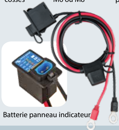
Batterie panneau indicateur