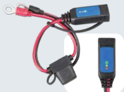
Batterie indicateur œillets M8

Mallette de transport pour chargeurs et accessoires