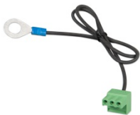
Connecteur avec un câble négatif CC préassemblé (inclus)