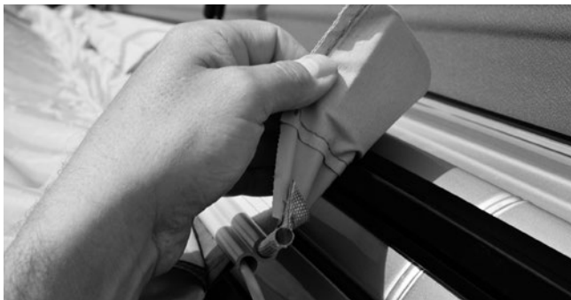
4. Sonderausstattung / special equipment: Magnetadapter / magnetic adaptor