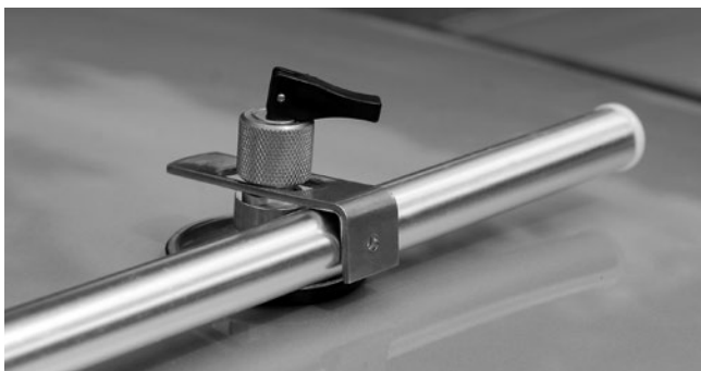
5. Sonderausstattung / special equipment: mit Klappsauger und Klemmstange/ with sucker and connection pole