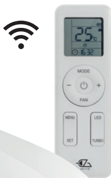
Télécommande avec mode Turbo